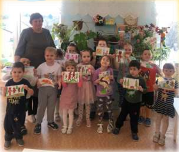
ИЗО деятельность «Рисуем сказки»