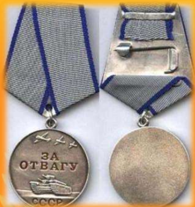
Медаль за отвагу

За героизм и подвиги на войне, солдаты награждались орденами и медалями.