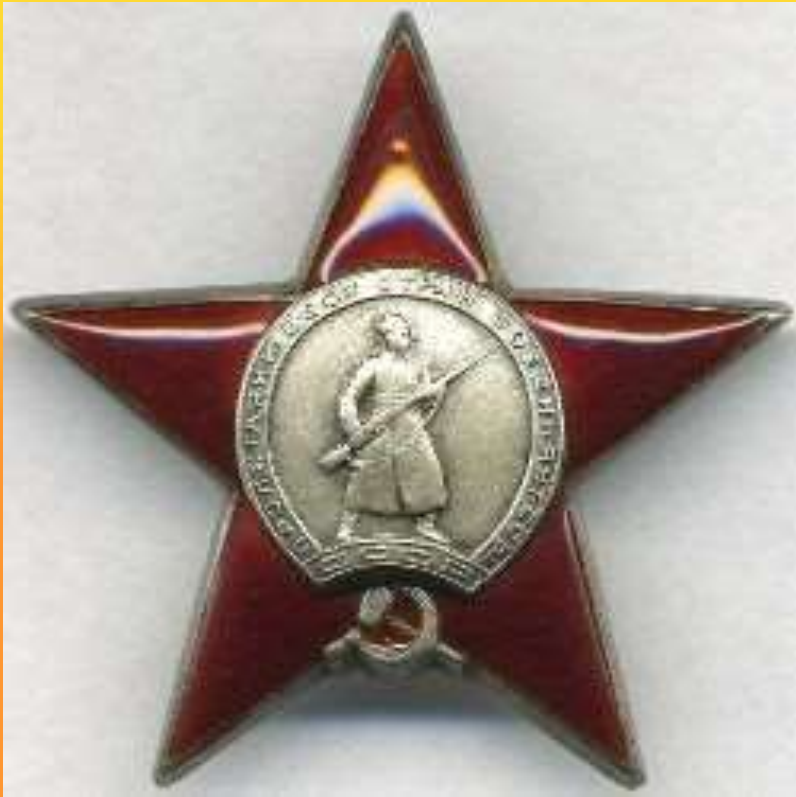
Орден красной звезды