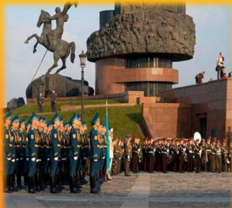
Поклонная гора в Москве