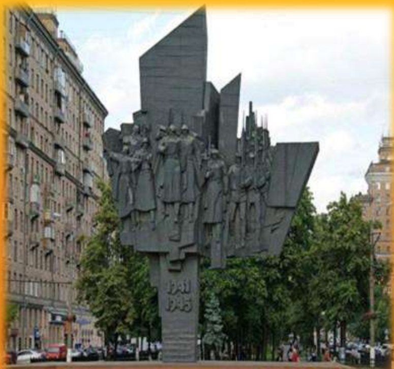
Монумент- «Защитники Москвы»