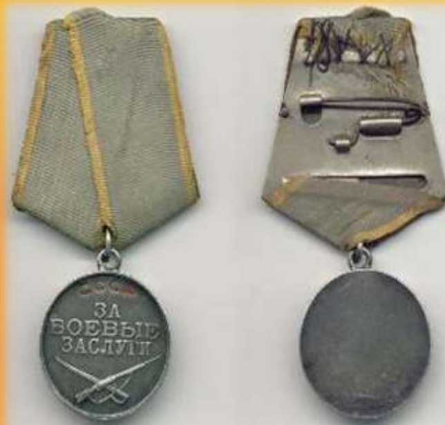
Медаль за боевые заслуги